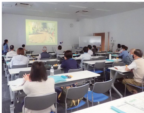
実習地の様子を振り返りました